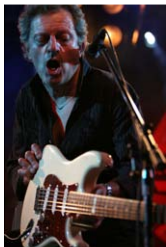
Europäische Spitzenklasse bei den 10. Darmstädter Blueswochen: Der italienische Bluesgitarist Rudy Rotta spielt am Do., 05. 11. im House of Blues.

Sonntag, 08., 22. & 29. 11., 13.00 bis 15.00 Uhr „Hallo Darmstadt“ – drei mal im November